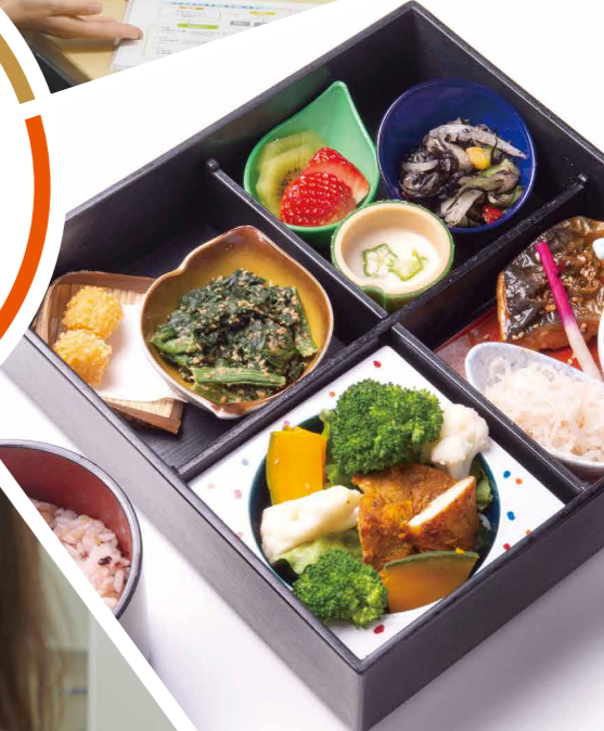
管理栄養士考案の お弁当ランチをご提供