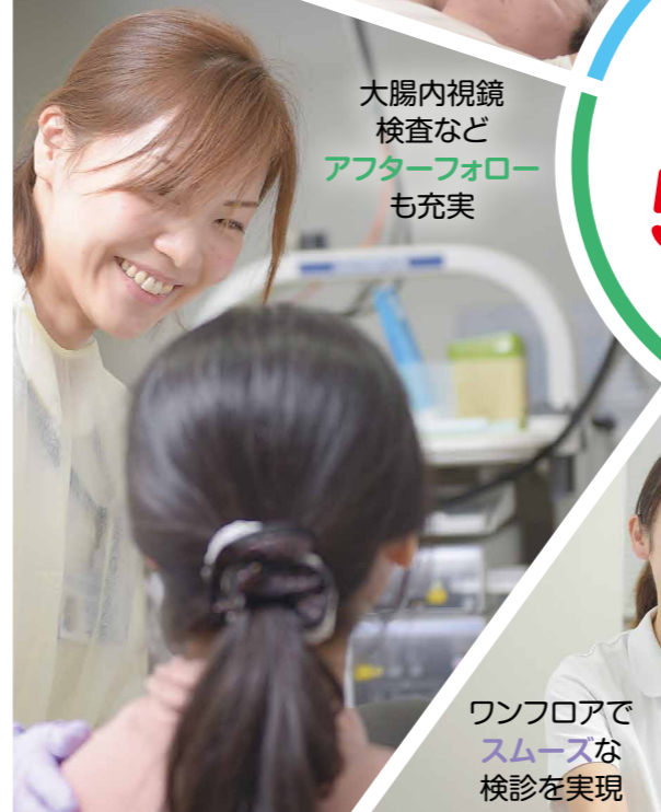
大腸内視鏡 検査など アフターフォロー も充実