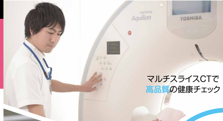
マルチスライスCTで 高品質の健康チェック