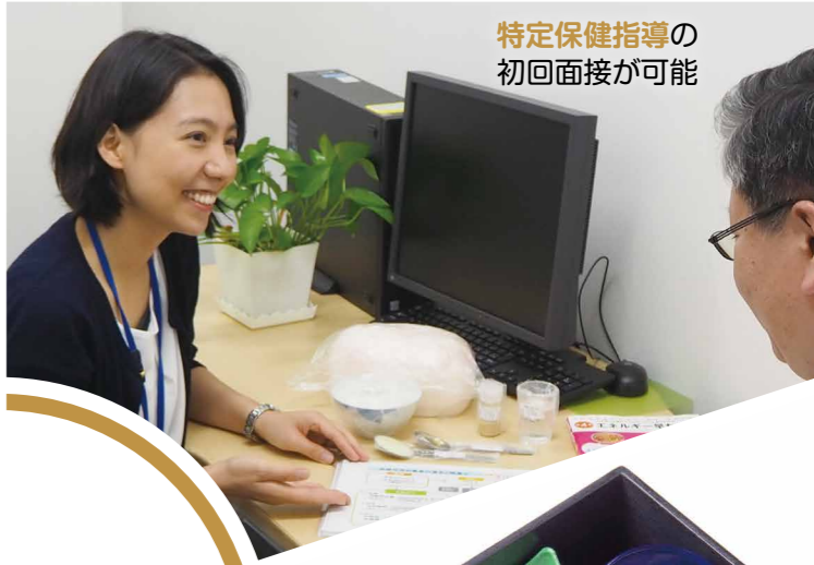
特定保健指導の 初回面接が可能